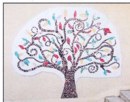
Mosaïque réalisée par les élèves de l'école élémentaire de Gurcy-le-Châtel

La cantine de Gurcy-le-Châtel accueille en moyenne 85 enfants chaque jour.