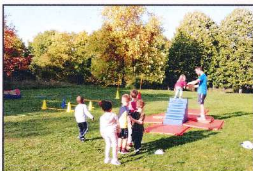
Première séance pour les plus petits

Les enfants inscrits ont repris le chemin de l'école multisports le mercredi 5 octobre. Ils sont répartis en trois groupes selon leur âge :