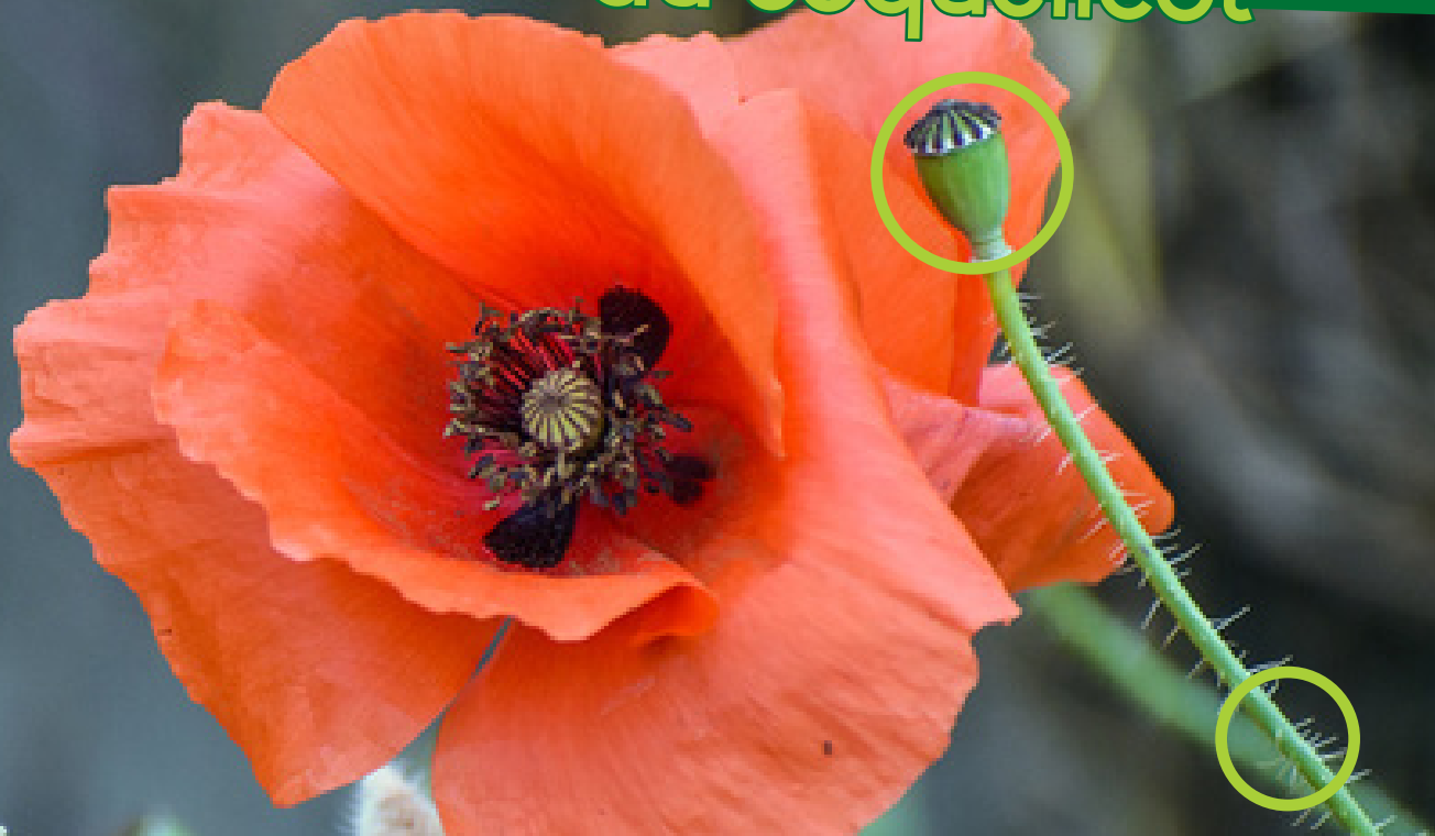
Coquelicot - Papaver rhoeas